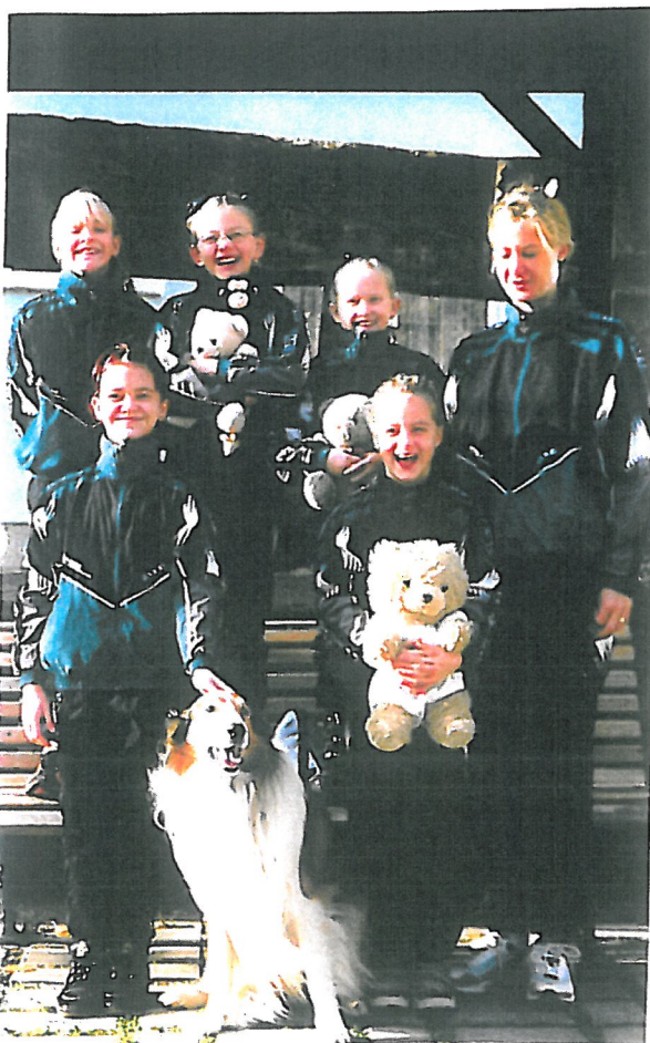
Abbildung 5. Martini-Cup 2001