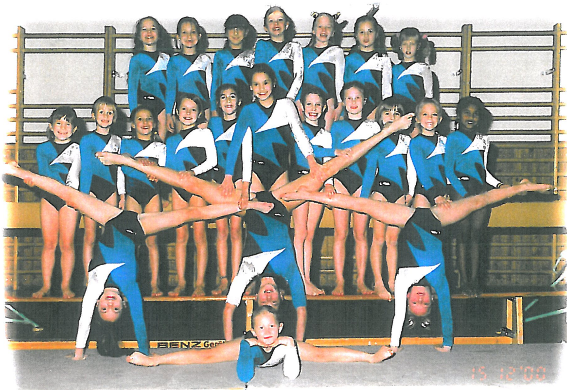
Abbildung 1. Die Leistungsriege des Halleiner Turnvereines 1866.